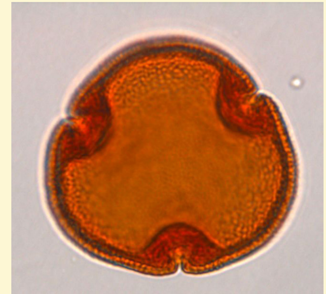
Stuifmeel van linde (Tilia)